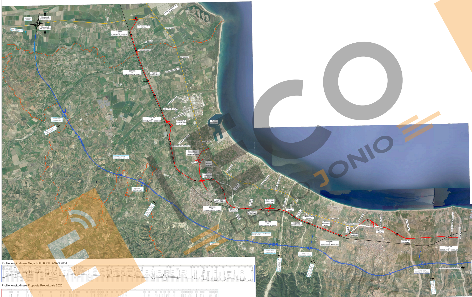
Profilo longitudinale Mega Lotto 8 P.P. ANAS 2004